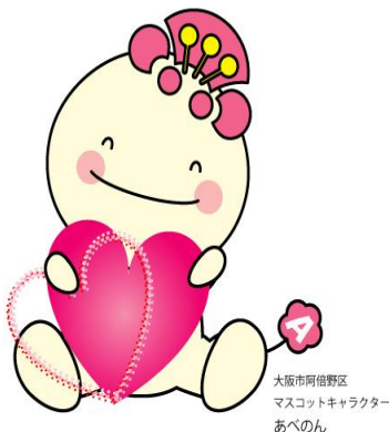
大阪市阿倍野区 マスコットキャラクター あべのん

申し込み時にご記入いただきました個人情報は当講座に関するご連絡および受講状況の分析にのみ利用し、第三者への提供・開示することはありません。